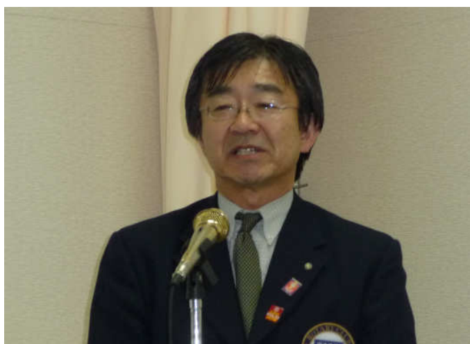
白木会長創立記念挨拶