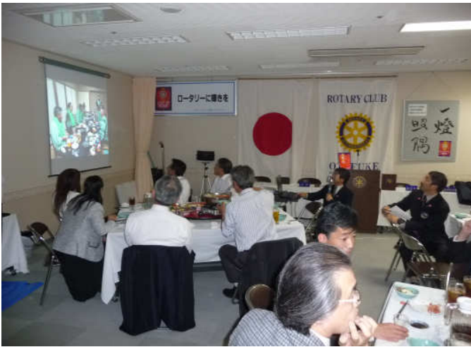
白木会長鹿屋市地区大会報告