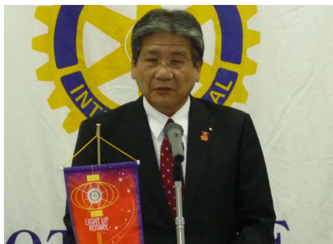
寺山音更町長挨拶