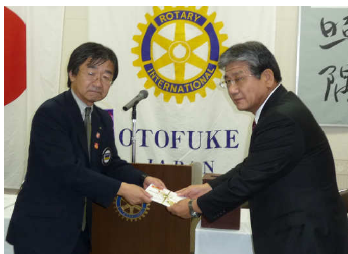
音更町へ図書購入費贈呈