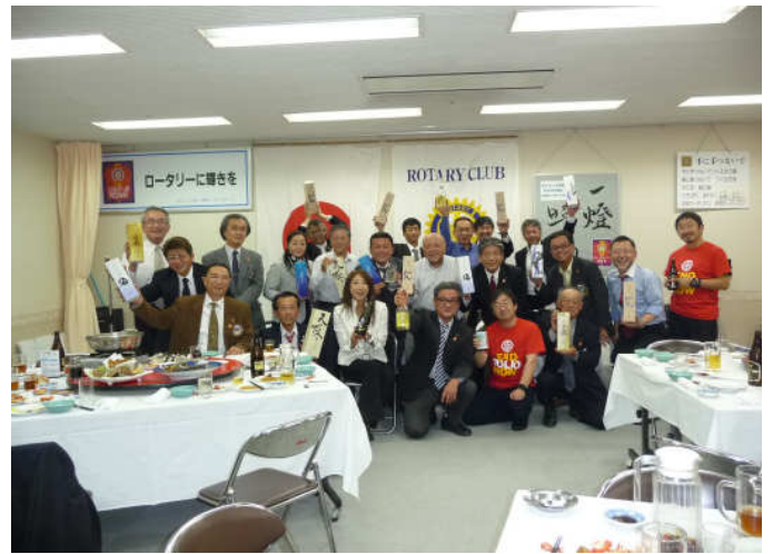
音更RC創立記念撮影