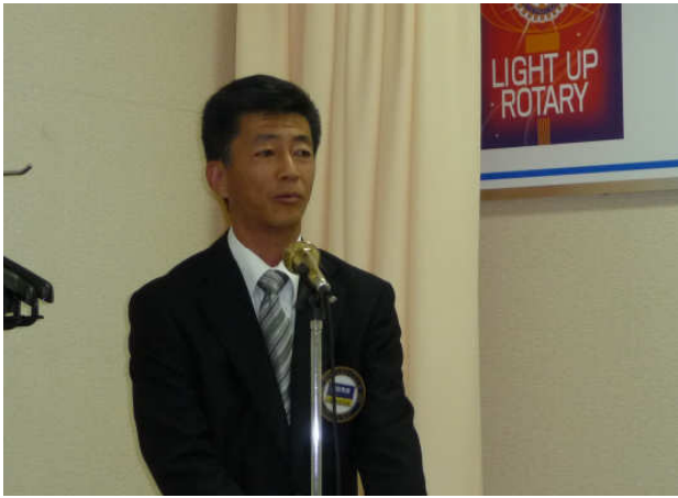
プログラム富田委員長 会員卓話紹介