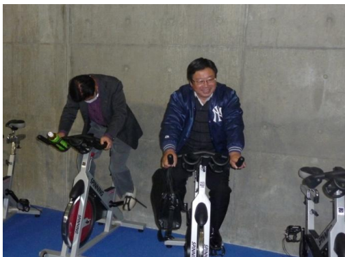
筋トレはトレーニング室もあり200円でOKです。