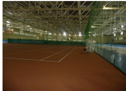
リクの内側にはフットボールコート3面。