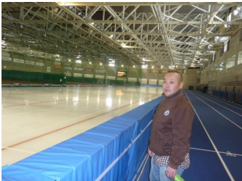
12月にはワールドカップが開催されます。