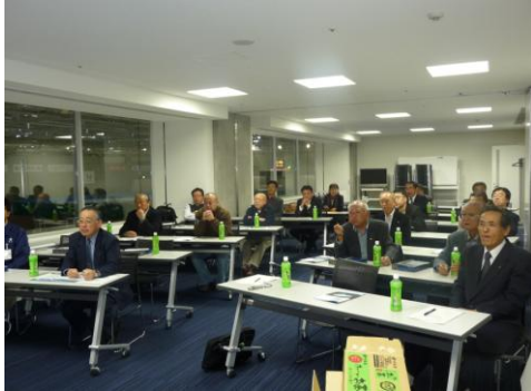
全国で2番目の屋内施設です。