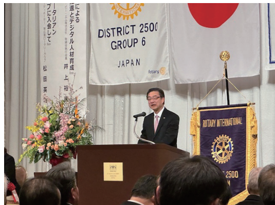
来賓挨拶～帯広市長 米沢則寿