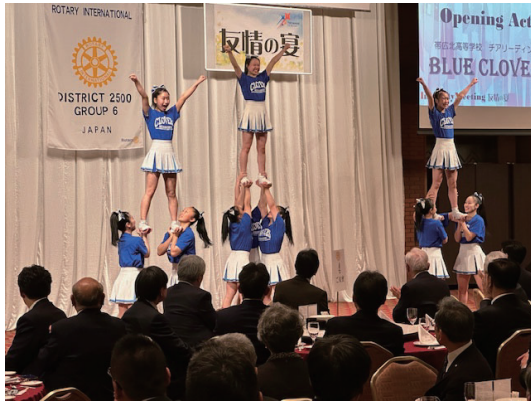
オープニング～ 帯広北高校「ブルー・クローバー」演舞