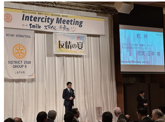
乾杯～ガバナーエレクト 佐渡正幸