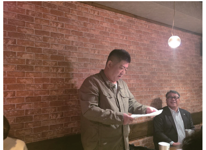
締め挨拶(後藤会員)