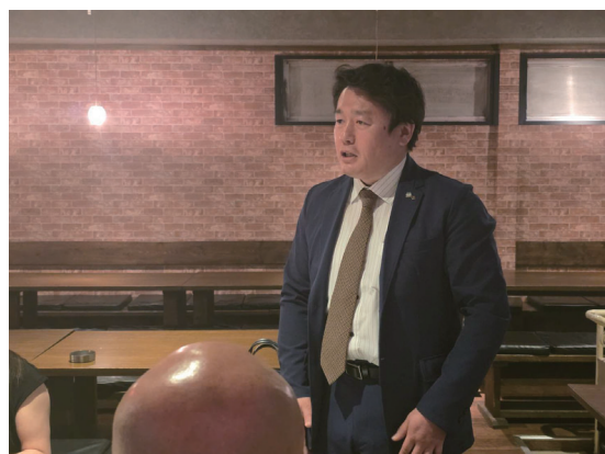
畠山プログラム委員長