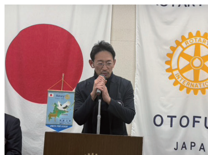
プログラム紹介 (担当:玉川出席委員長)