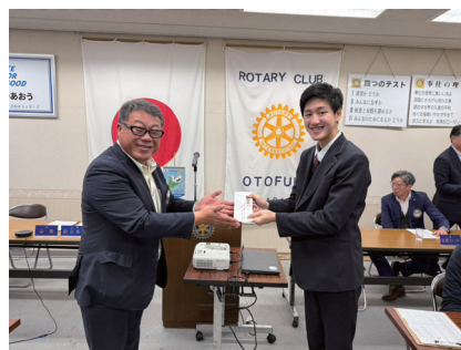
今月の おこずかい 贈呈