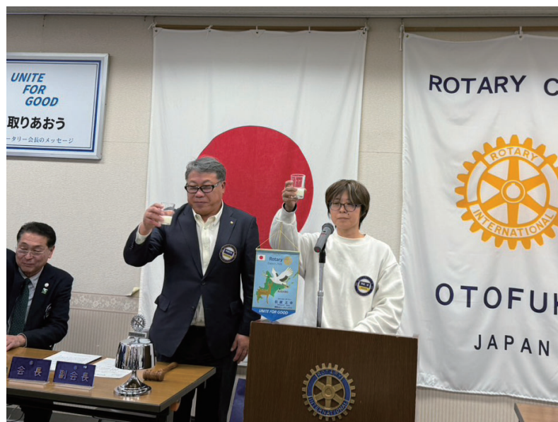
お祝いの言葉・乾杯(高島)