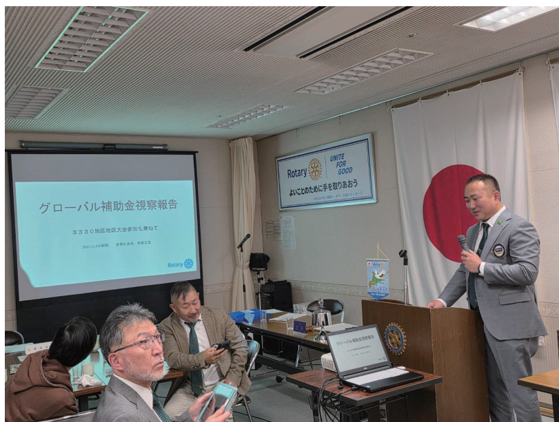
グローバル補助金視察報告 長屋会長