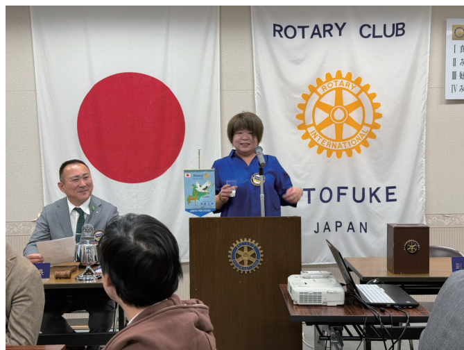
お祝いの言葉(竹村会員)