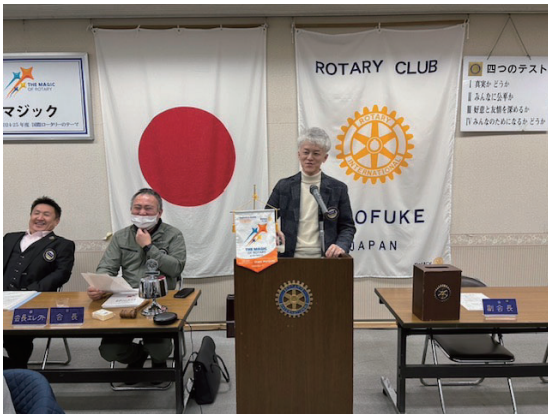
お祝いの言葉～作田会員