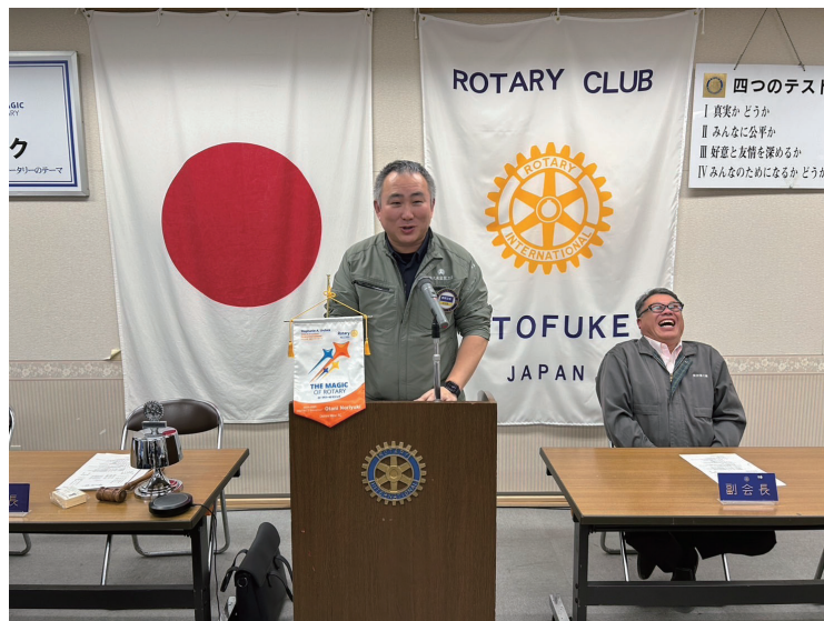
会長挨拶～長屋 会長エレクト