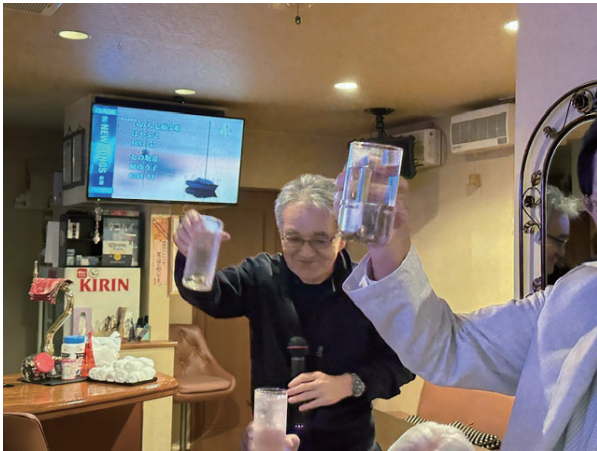
懇親会二次会乾杯