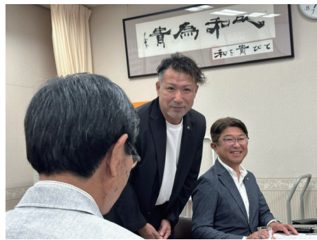
鹿屋 RC 内野 幹事