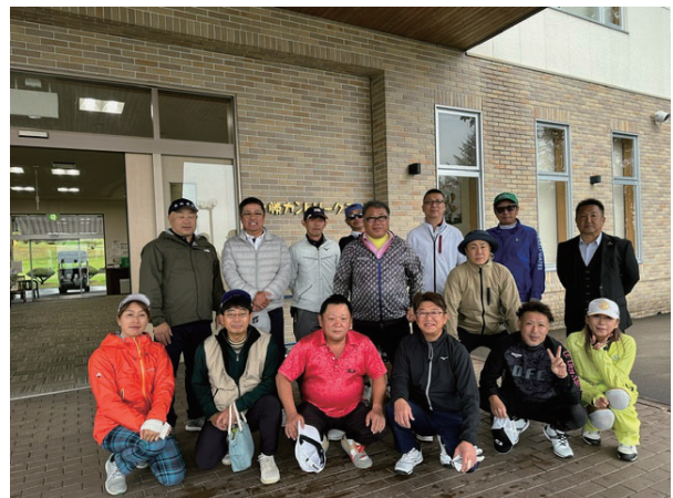
親睦ゴルフ集合写真