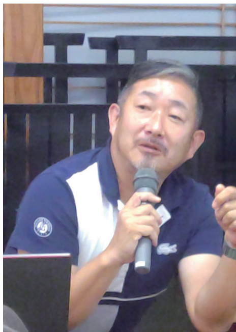
会員卓話～行木 委員長