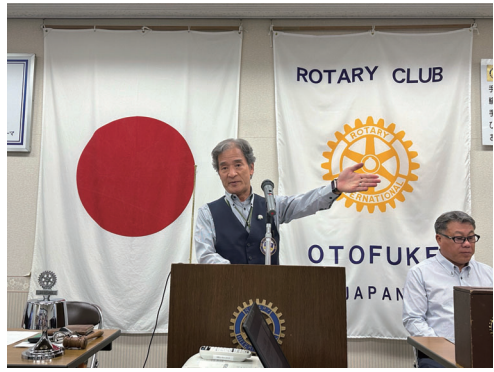
ゲスト紹介～中西会長