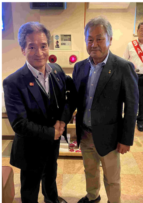
会長次年度バッジ交換後