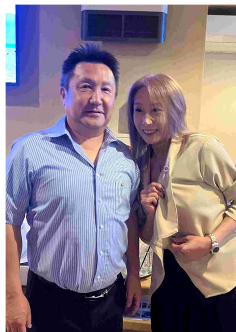
幹事バッジ交換後