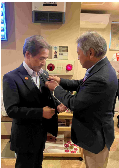
会長次年度バッジ交換