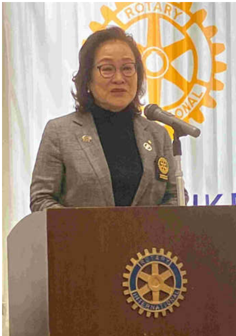
小田ガバナー補佐挨拶