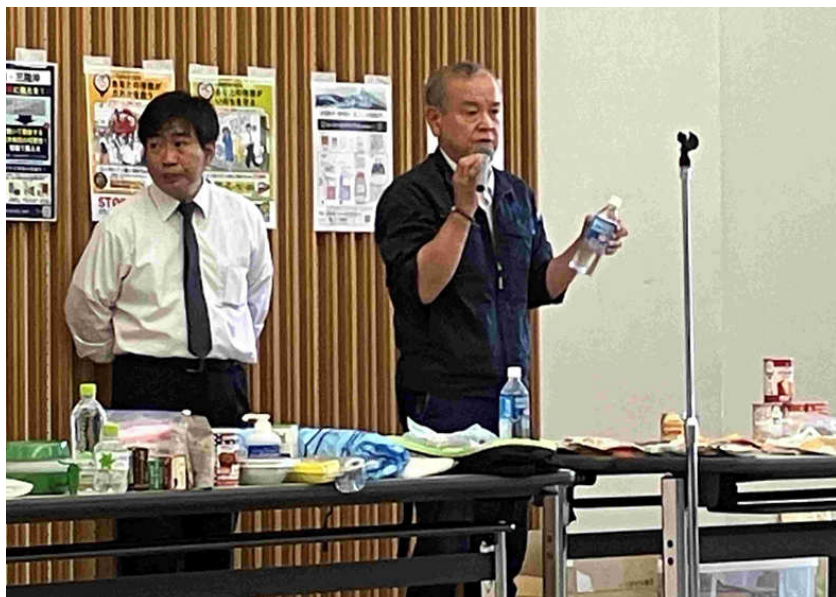
防災用品説明、(株)ムラカミ西山道東営業所所長