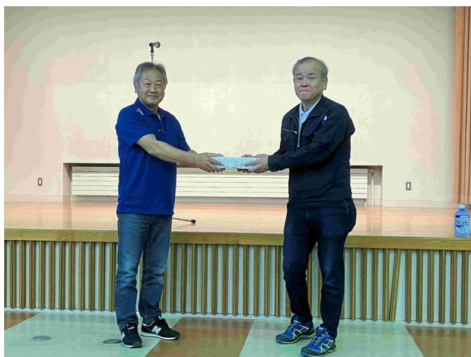
プログラムのお礼品贈呈