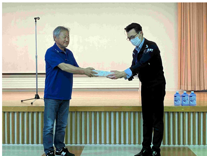
プログラムのお礼品贈呈