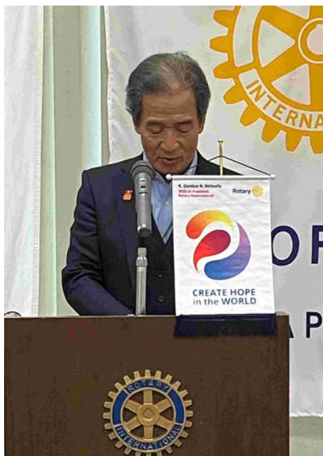
ゲスト・ビジター紹介、中西会長エレクト