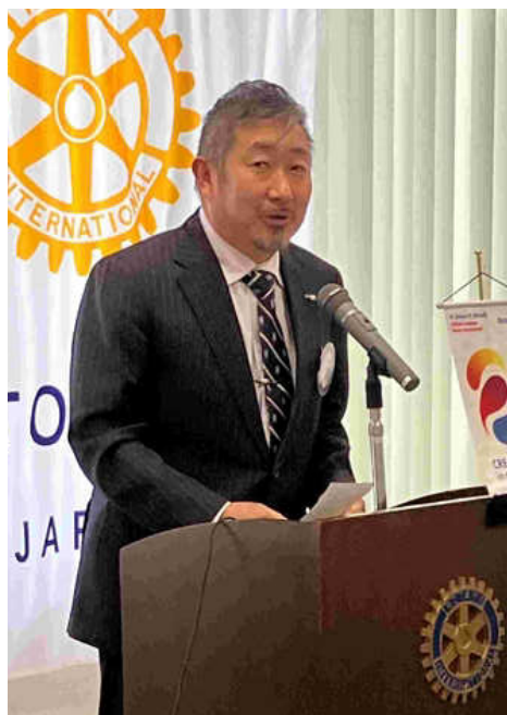
出席報告、行木前出席委員長