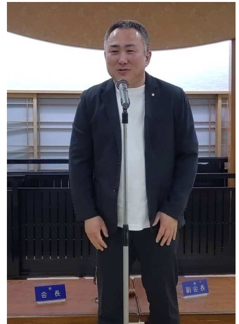
中締め、長屋チーフセクレタリー