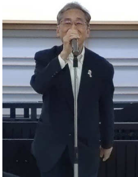
大和 IM 実行委員長