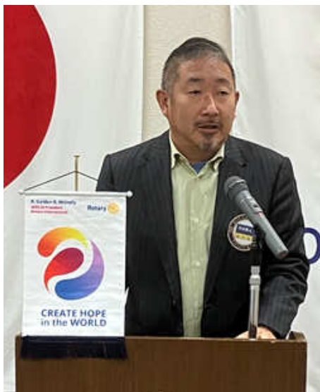
委員会報告 行木会員