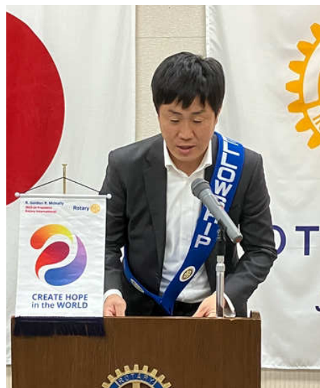
結婚祝、誕生祝、 ニコニコ献金 田中親睦委員