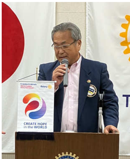
お祝いの言葉 小枝会員