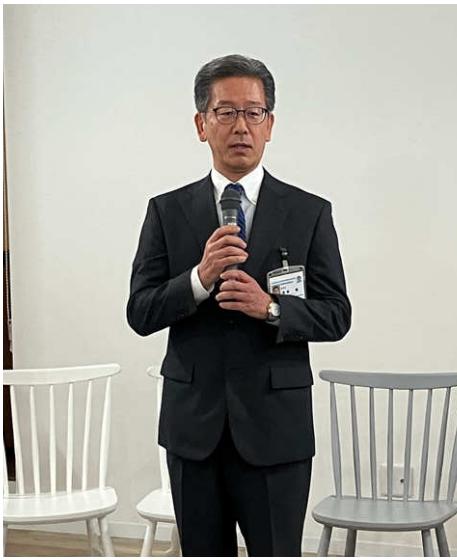
贈呈式後の挨拶 福地教育長