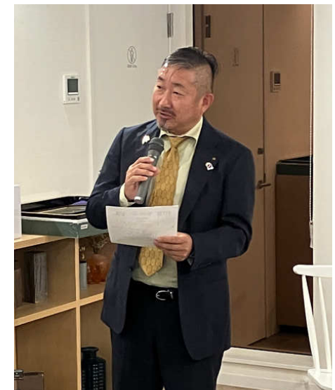
委員会報告 行木会員