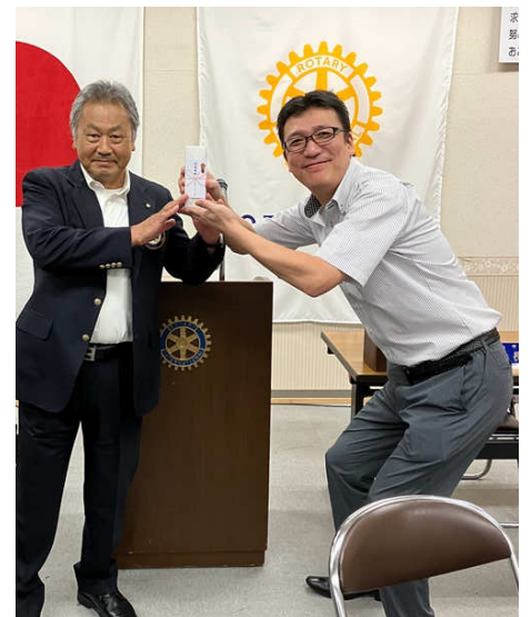
在籍表彰 中山会員