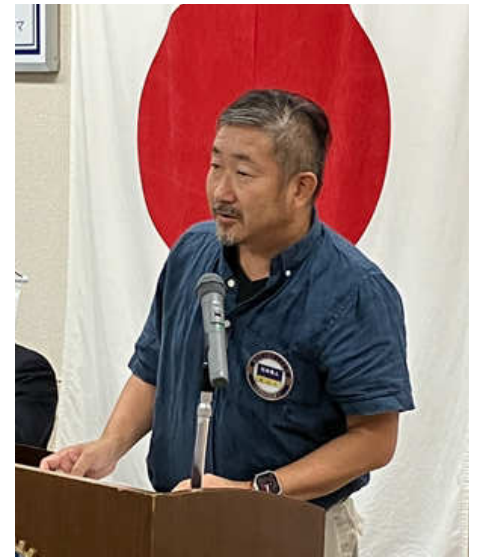
委員会報告 行木会員