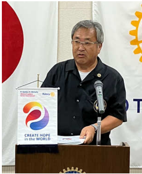
会員卓話 小枝会員