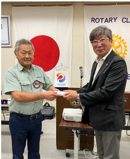
在籍表彰 若原会員