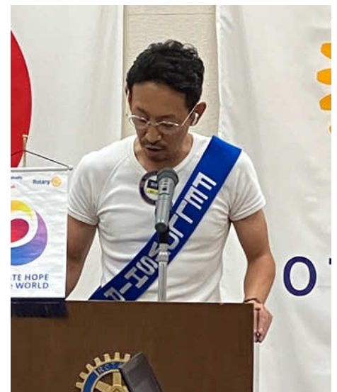
ニコニコ献金 玉川親睦委員長