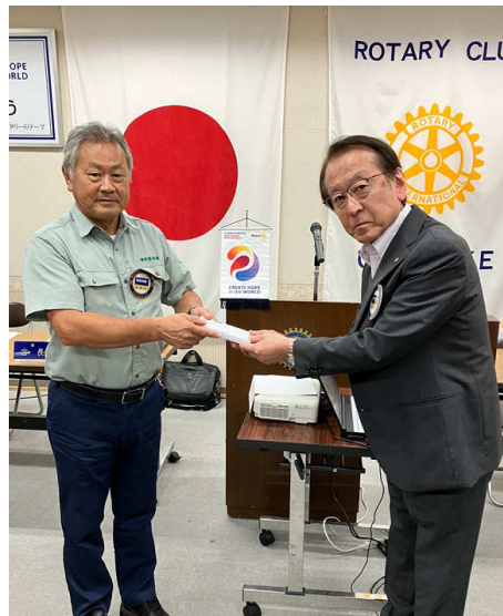
在籍表彰 向平会員