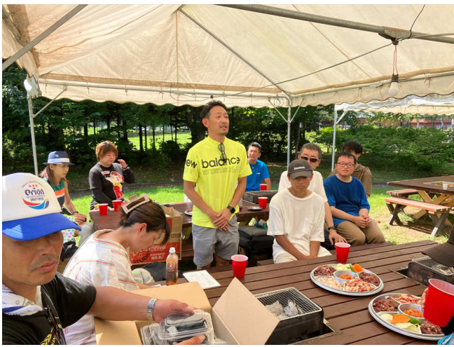
野遊会挨拶玉川親睦委員長