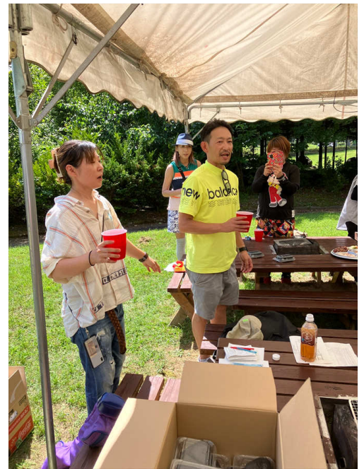
野遊会乾杯玉川親睦委員長