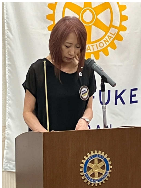
プログラム平尾幹事説明