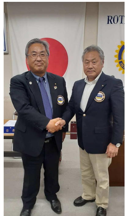
小枝会長（左）と阿部会長エレクト（右）