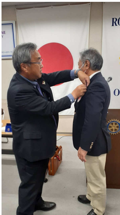
次年度バッジ交換