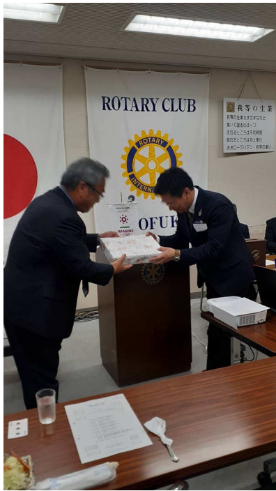
記念品贈呈 松原ガバナー補佐