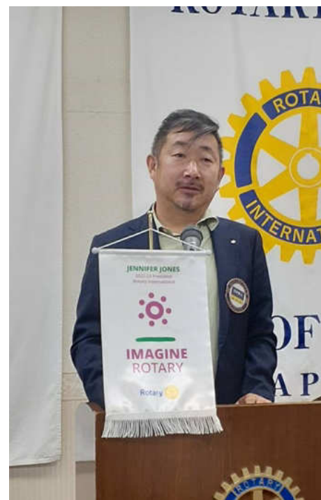
出席報告 行木出席委員長