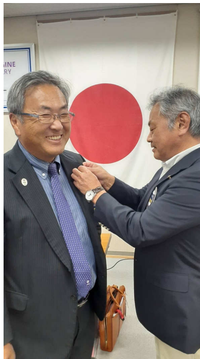
次年度バッジ交換