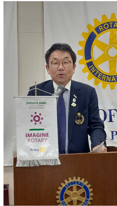
松原ガバナー補佐