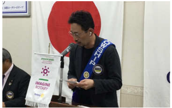
ニコニコ献金 玉川親睦副委員長