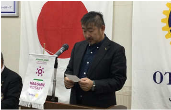
出席報告 行木出席委員長