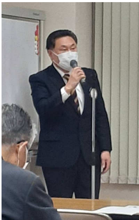
総司会 音更ライオンズクラブ 氏家第二副会長