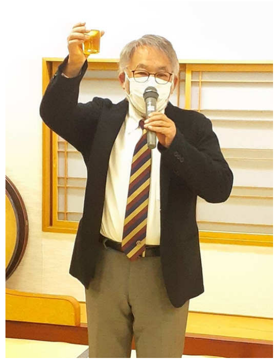
乾杯 音更ライオンズクラブ 坂井第一副会長