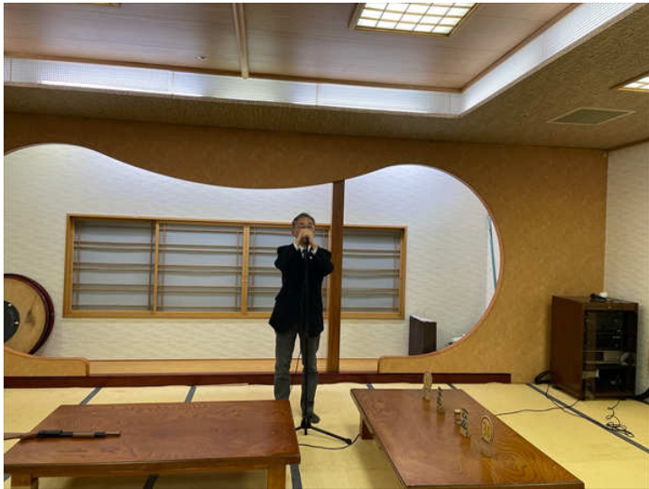
閉会挨拶 大和会員