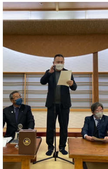
出席報告 長屋会員