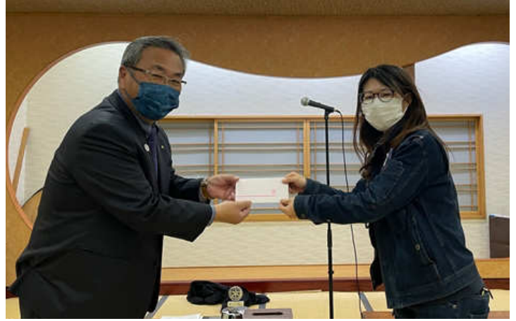
1月誕生祝い 高島会員