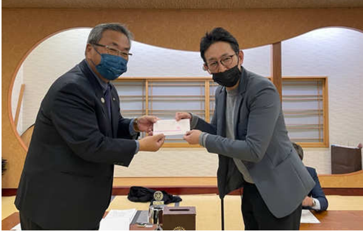
1月誕生祝い 玉川会員