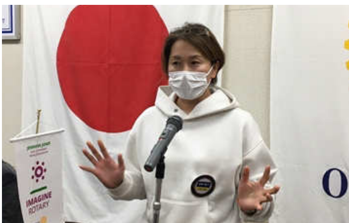
尾崎会員から一言