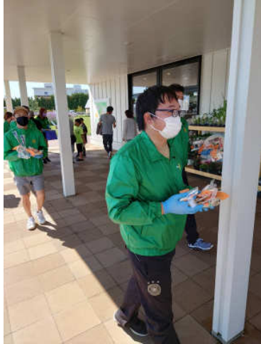
米山記念奨学生の高さんも参加してくれました