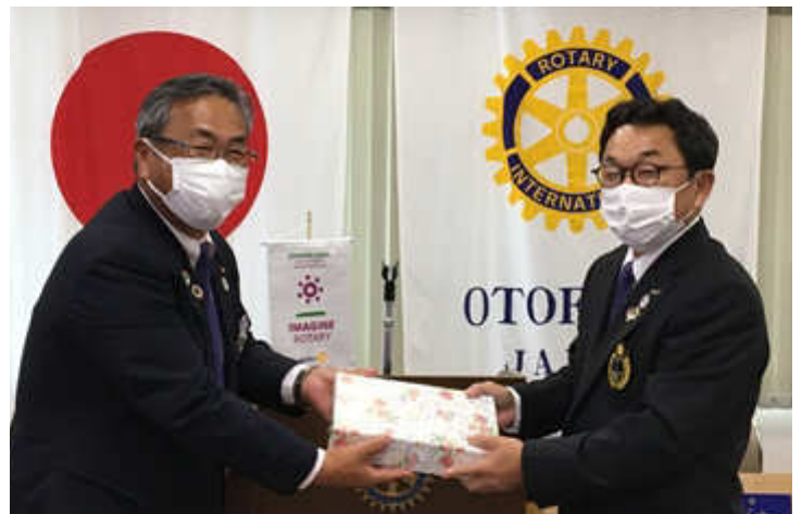
記念品贈呈 松原ガバナー補佐