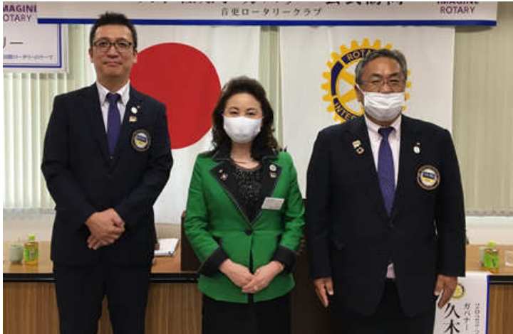
久木佐知子ガバナーと記念撮影