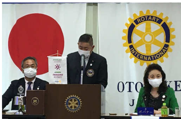
出席報告 行木出席委員長