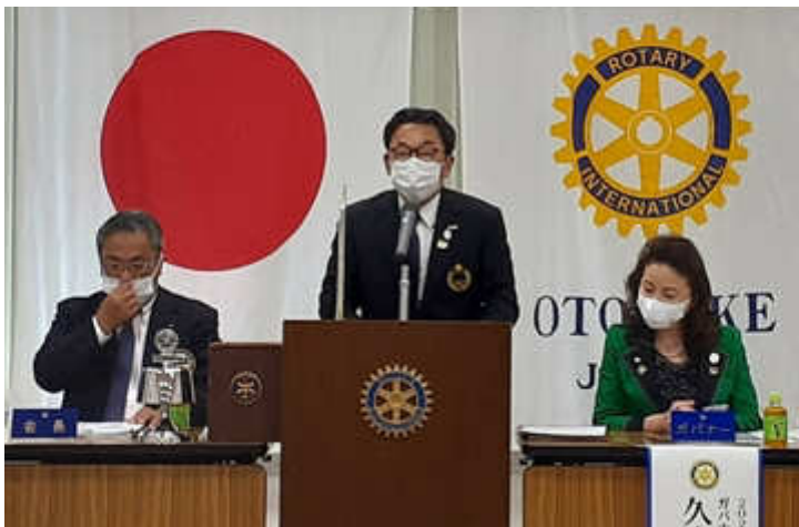
松原ガバナー補佐