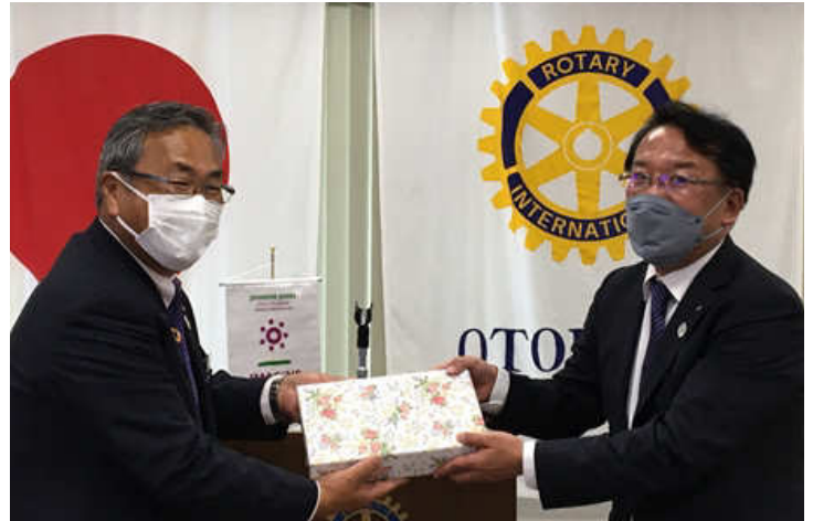
記念品贈呈 山北副幹事