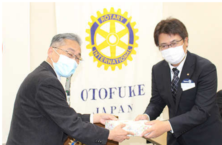
ゲスト ガバナー補佐セクレタリー大江 平 様