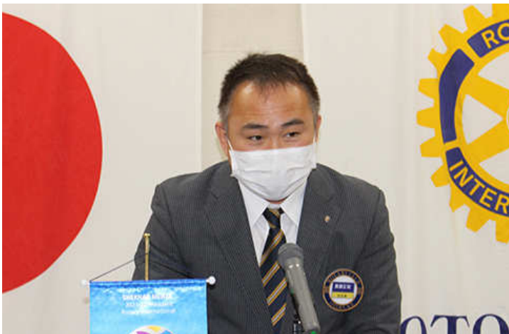
会務報告 長屋幹事