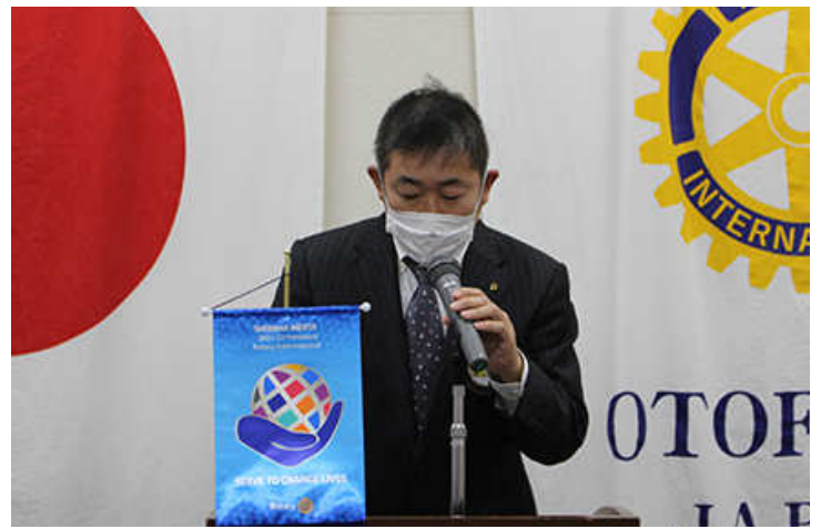
出席報告 行木会員