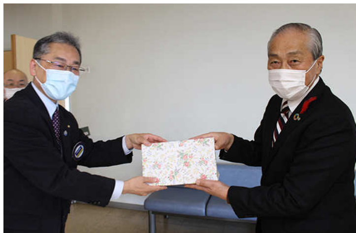
小野町長へお土産