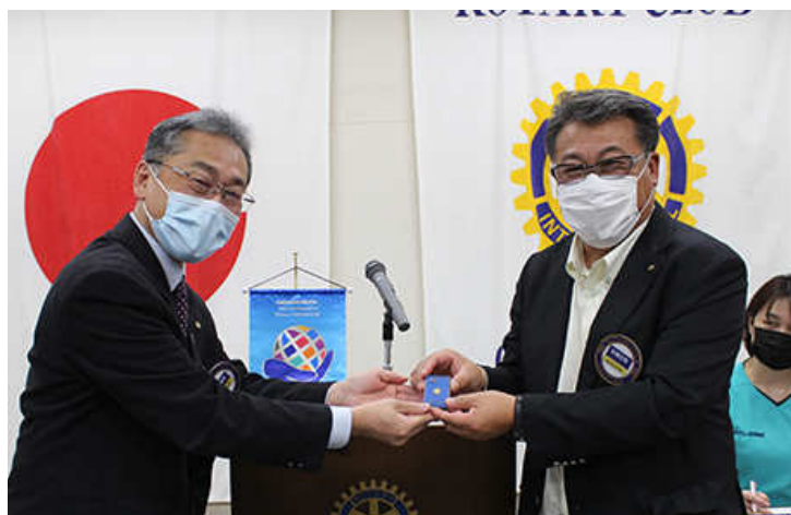
RI2500 地区から15年の表彰バッジ