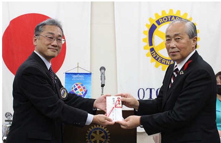
創立 29 周年記念例会音更町へ図書文庫購入費贈呈