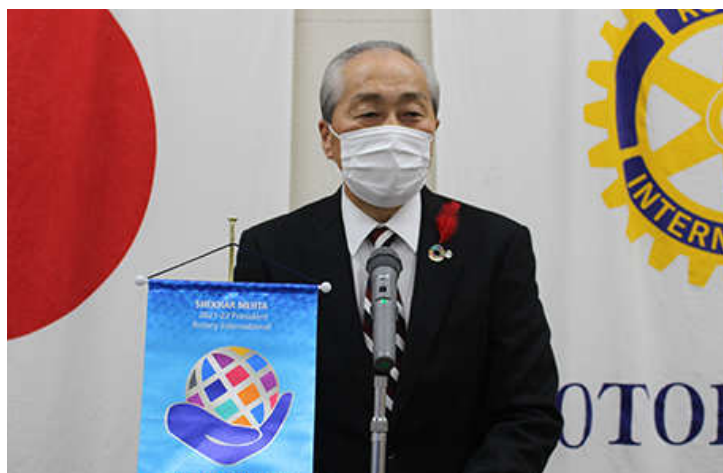
音更町長小野信次様j からお挨拶