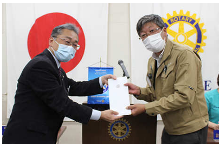
10月在籍表彰若原会員