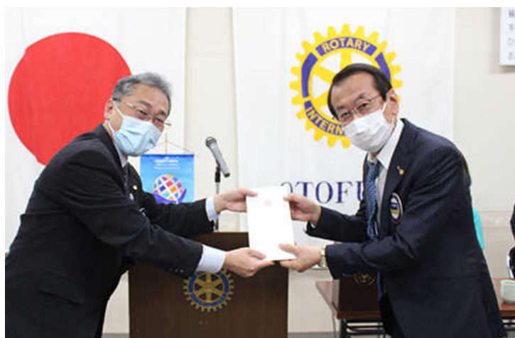
10月在籍表彰向平会員