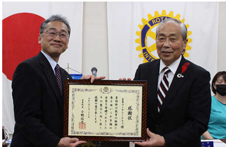
音更町から感謝状