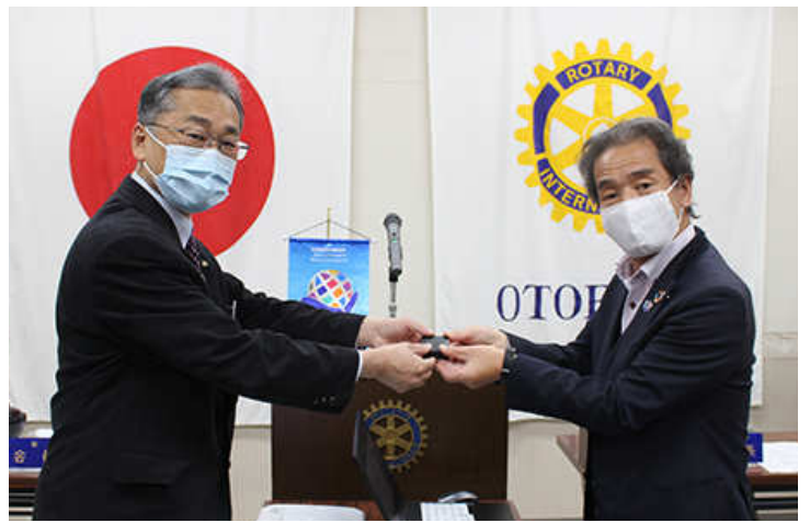
ポールハリスフェロー+1 バッジ中西会員