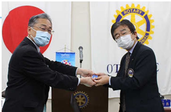
RI2500 地区から 15 年バッジ白木会員

15年 白木会員 15年 村瀬会員 25年 谷口会員 年数入りのバッジが届きました。