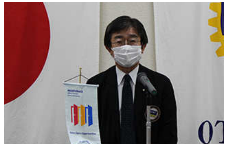
会員卓話十勝 RC 奨学会について