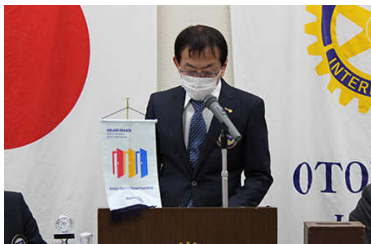
向平会員出席報告