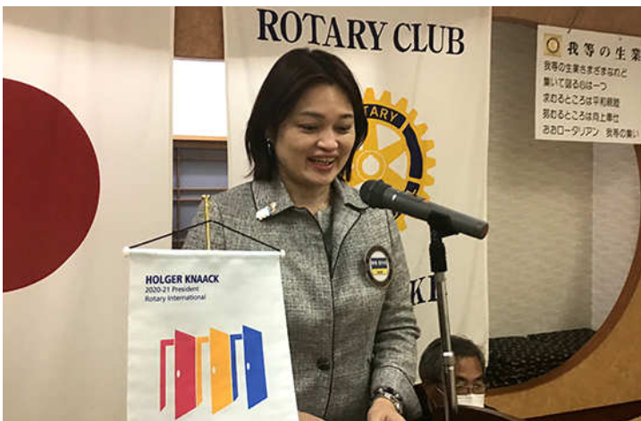
ニコニコ献金 栗栖会員