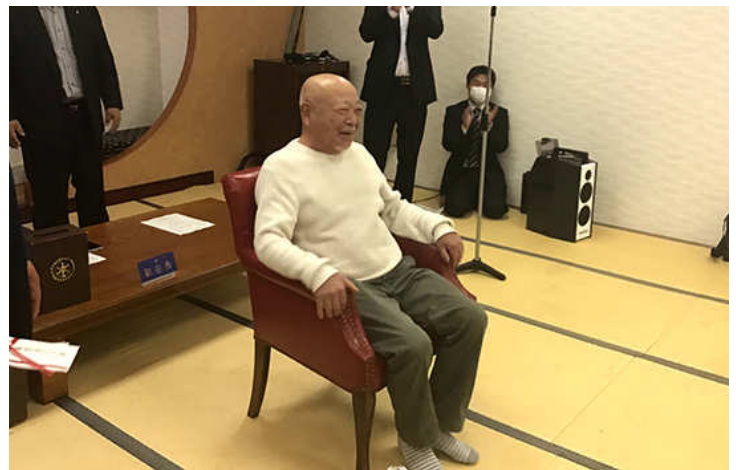
喜んで頂けました。