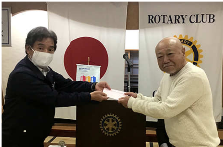
誕生祝い 黒川会員