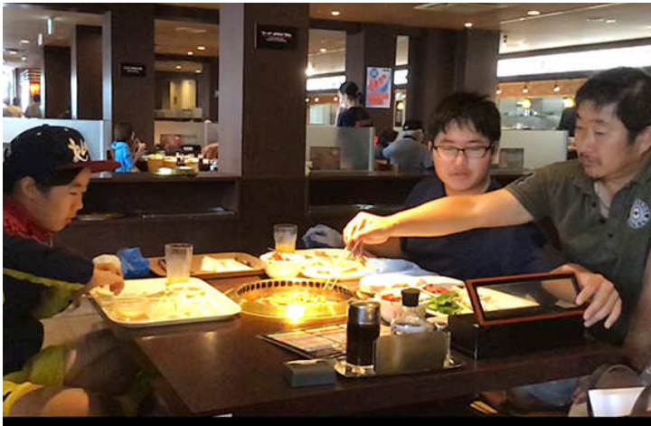
お子様と行木会員