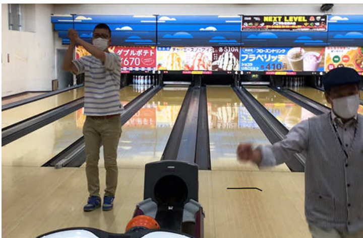
スペア中山会員ストライク中西会長