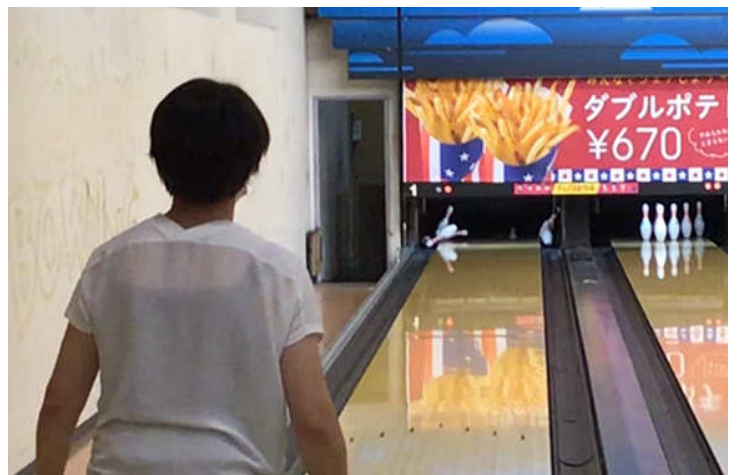
ナイスストライク 尾崎会員