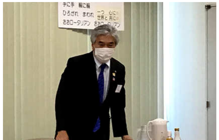
ゲスト紹介 柴田ガバナー補佐