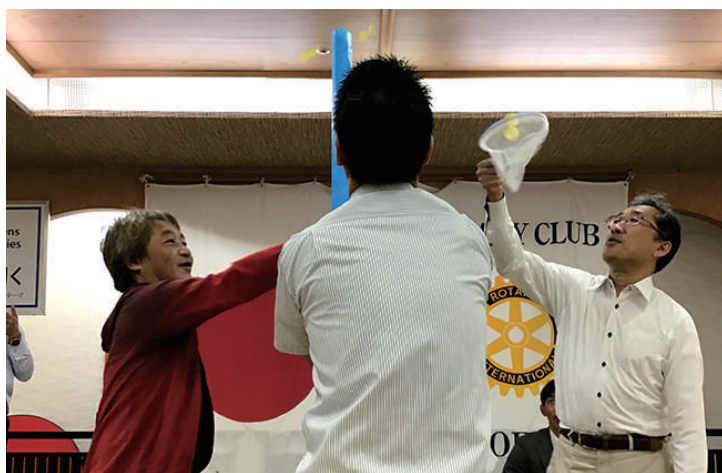
ゲーム中 室屋会員 大和会員