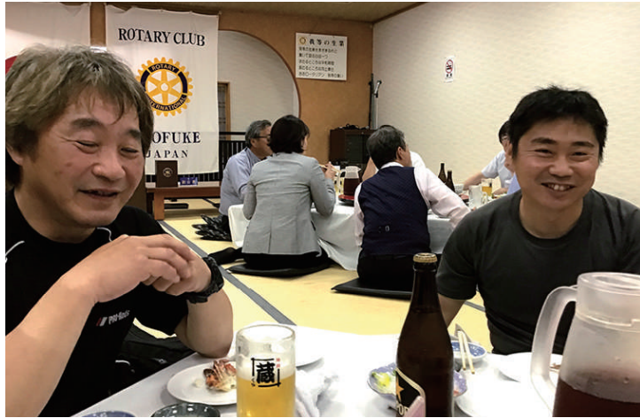
宴会 室屋会員 真鍋会員