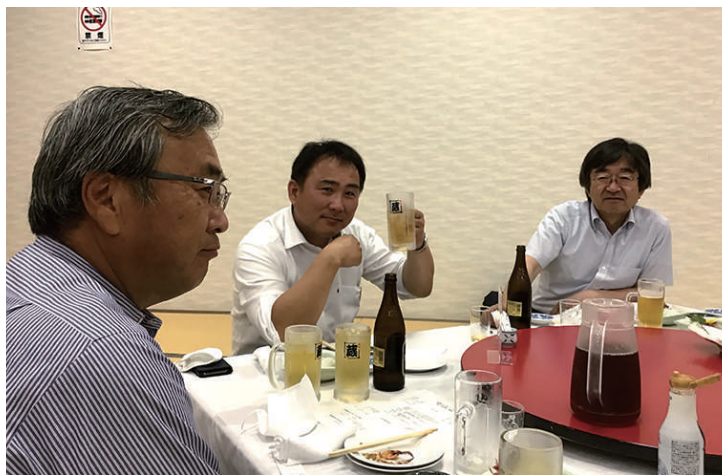
宴会 小枝副会長 長屋会員 白木会員