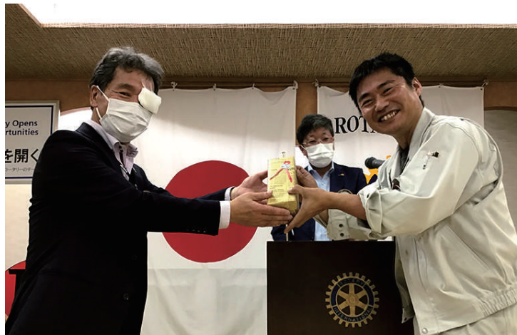
誕生日のお祝い 真鍋会員