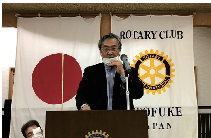
オンツアー台湾についてお話をされる小枝副会長