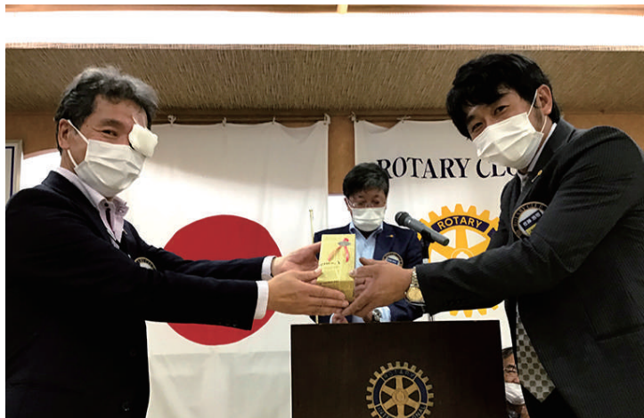
誕生日お祝い 宇野会員