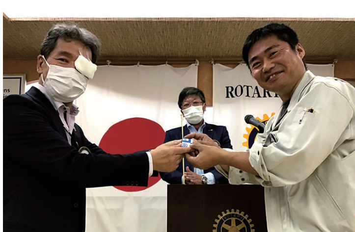
永年表彰 真鍋会員