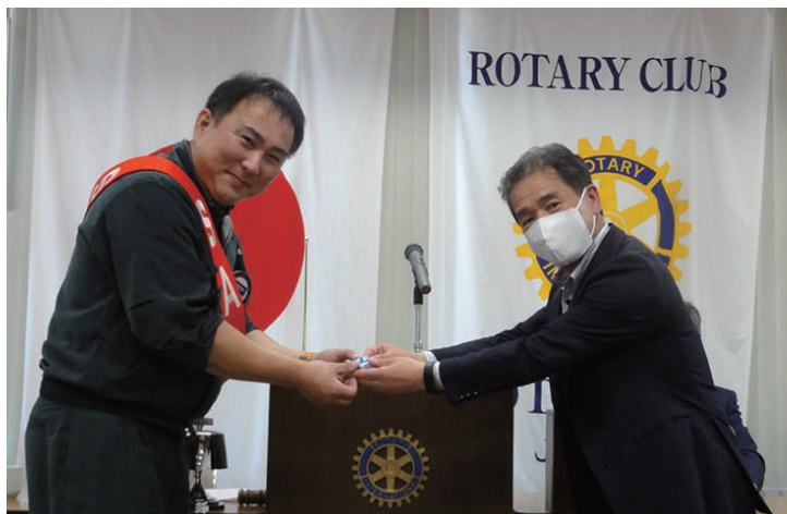
在籍表彰 長屋会員 7年目