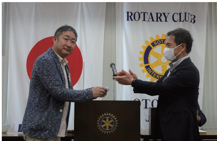
在籍表彰 行木会員 9年目