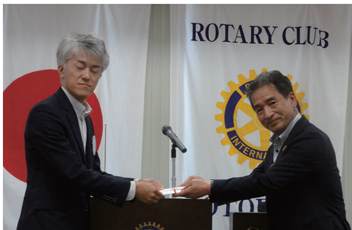
お見舞金贈呈 作田会員