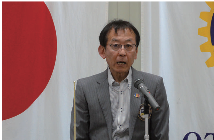
出席報告 向平会員 今年度も数多くの出席をお願いします！