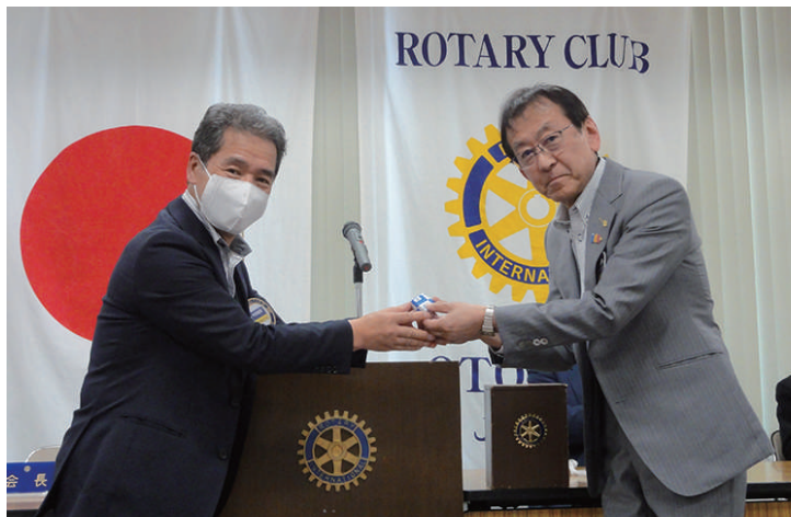
在籍表彰 向平会員 17年目