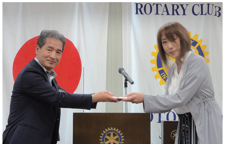
お見舞金贈呈 平尾会員