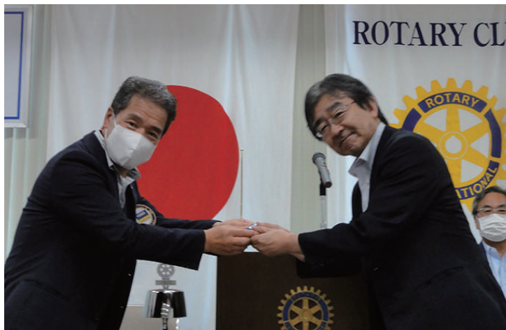
在籍表彰 白木会員 15年目