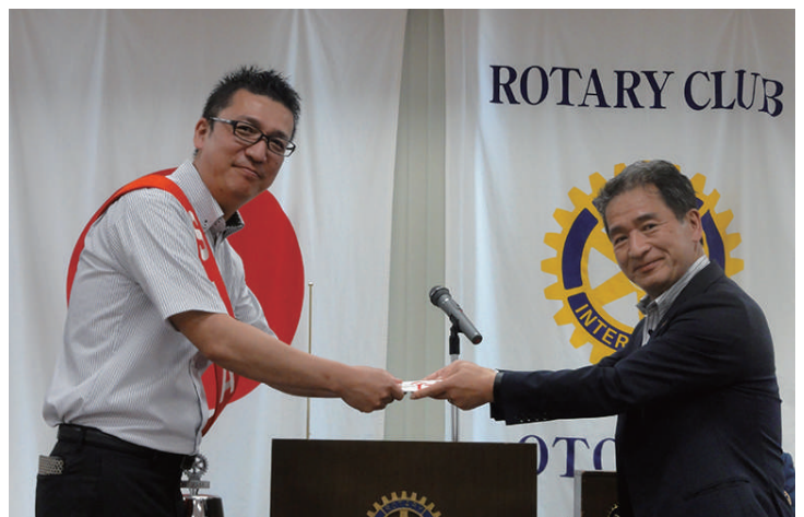
お見舞金贈呈 中山会員