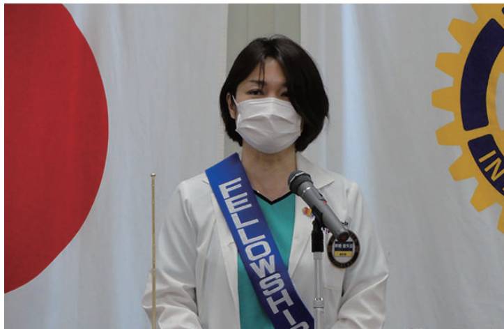
ニコニコ献金報告 栗栖会員