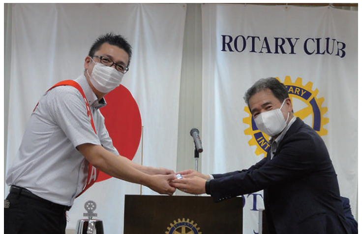
在籍表彰 中山会員 2年目