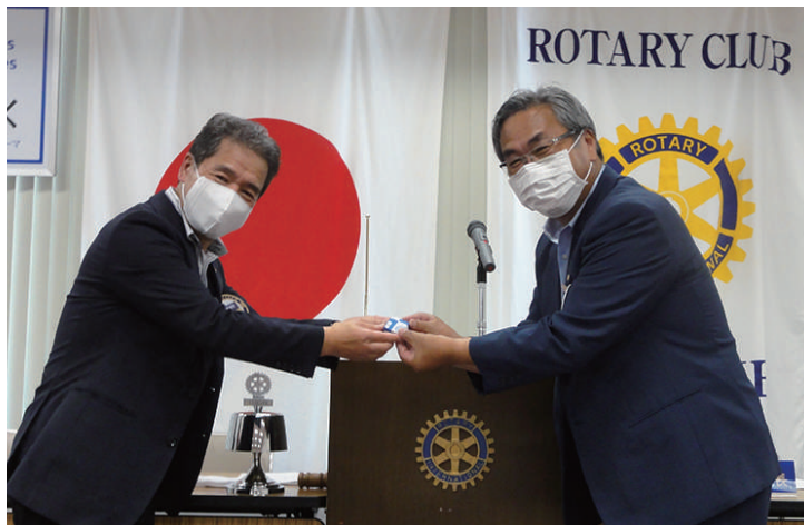
在籍表彰 小枝会員 12年目