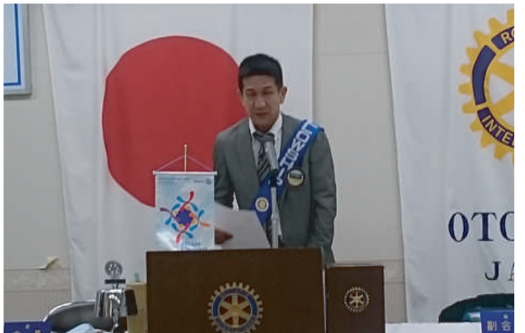
ニコニコ献金報告 早川会員