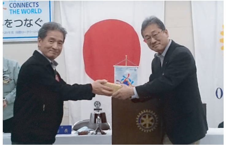
誕生祝 大和副会長