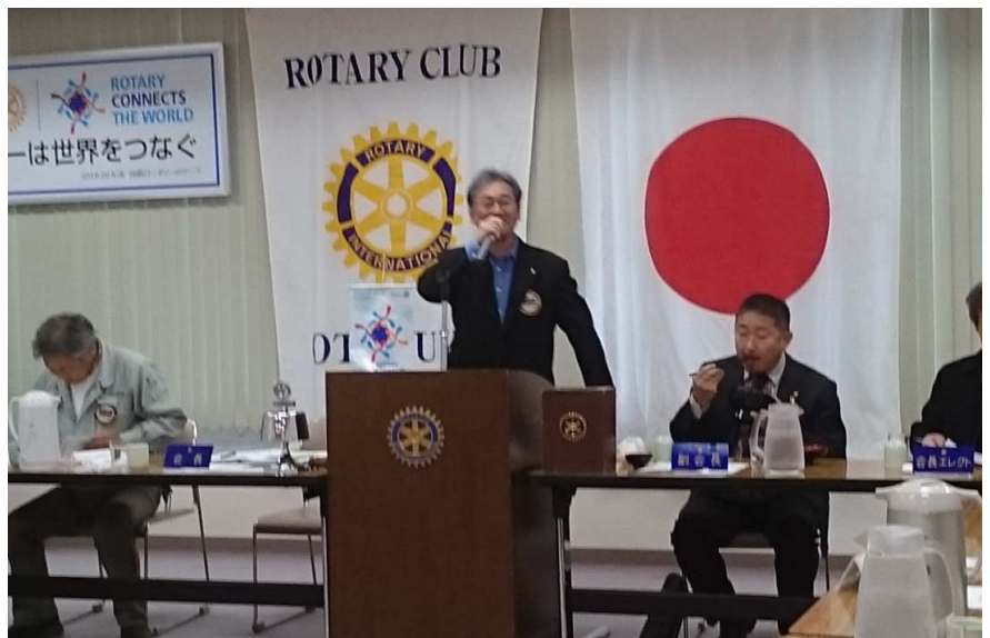
会長挨拶 大和副会長

会長が欠席のため、挨拶させていただきます。 私、岩手の学生の指導のため、例会を2回ほど休んでしまい申し訳ありません。 最近は、日に日に寒さを増しております。 体調管理には皆さんお気をつけください。