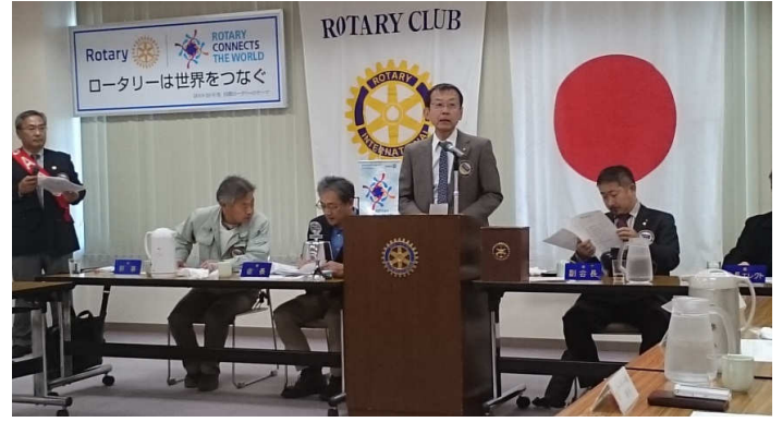
出席報告 向平会員