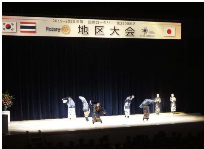
オープニング 「イランカラプテ」アイヌ民族による演奏

オープニングにて、アイヌ民族による「イランカラプテ」（アイヌ語で「こんにちわ」、「あなたの心にそっとふれさせていただきます」という意味）をテーマに演奏や歌を披露。