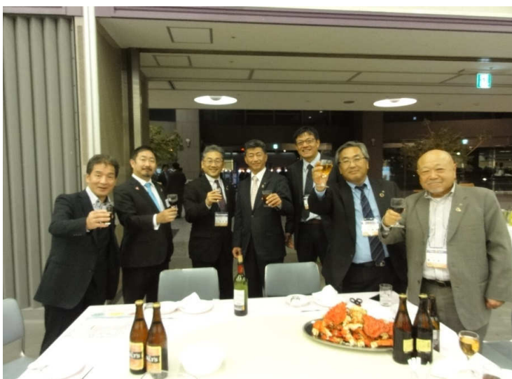
飲み物は先行して・・・