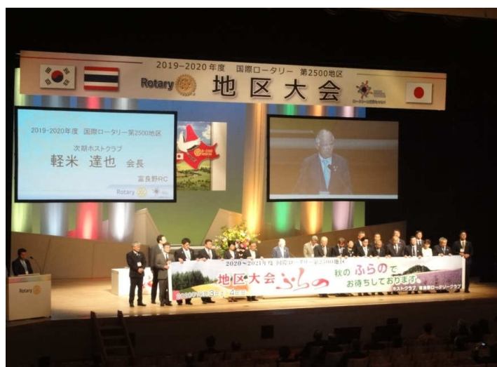
次期ホストクラブ会長挨拶 次回は富良野 10月3日、4日です