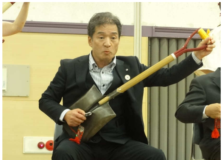
気づけばステージでチューニング？