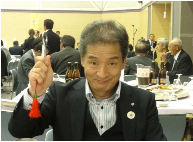
お土産のバチ（栓抜き?）