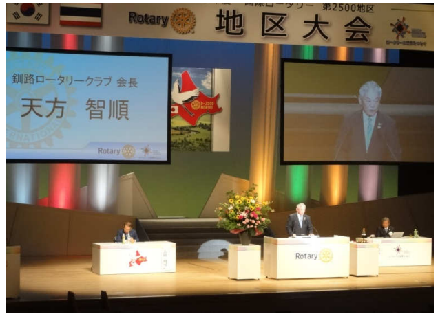
歓迎の言葉 天方釧路RC会長