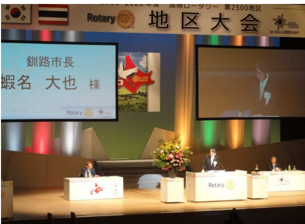
来賓挨拶 蛸名釧路市長