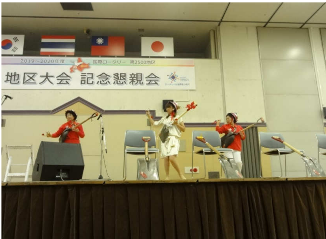
アトラクション スコップ三味線