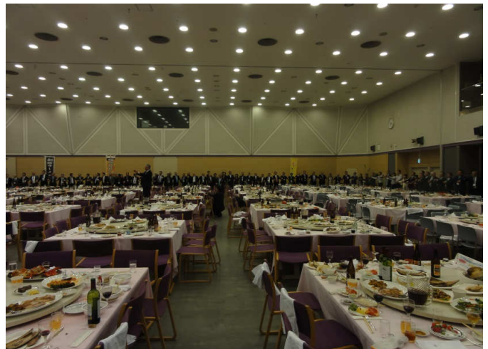
会場全員で「手に手つないで」