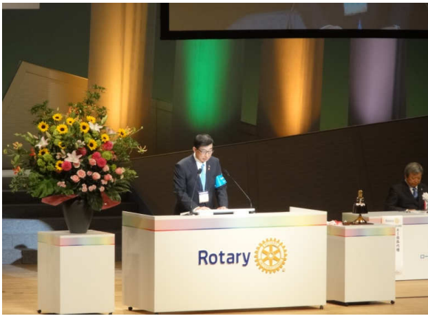
開会宣言 青田地区大会実行委員長