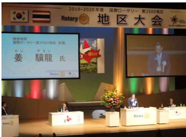
姉妹地区総裁挨拶 姜RI3590地区総裁