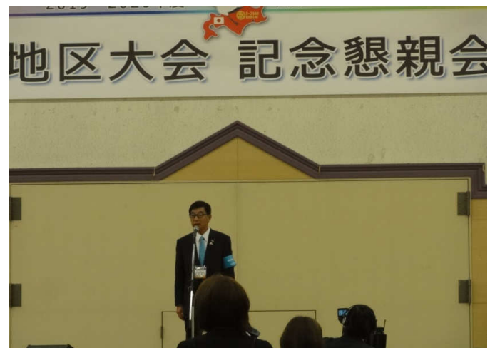
開宴のことば 青田地区大会実行委員長