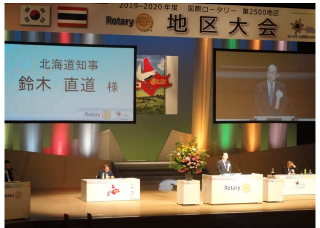
来賓挨拶 鈴木知事 代理釧路振興局長