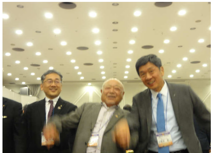
黒川会員も元気よく！！