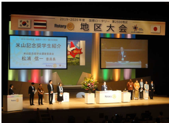
米山記念奨学生紹介

米山記念奨学金学生紹介では、海外から日本の大学に通い、流暢な日本語で努力を重ねている様子を伺い知ることができました。