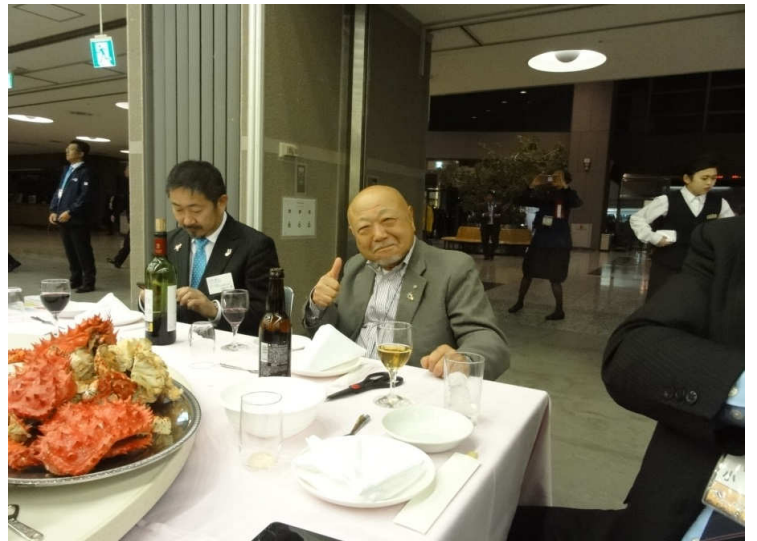
挨拶中もお食事はガマン