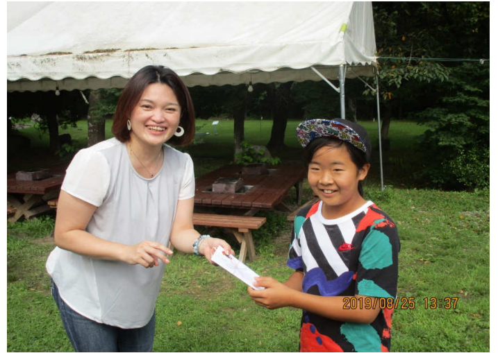
子供賞 笑顔が素敵