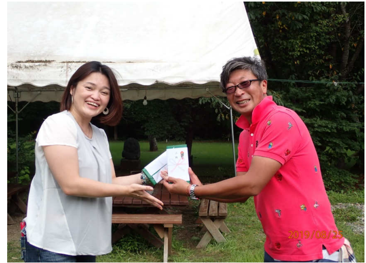
同スコア3位の若原会員 さすが！！