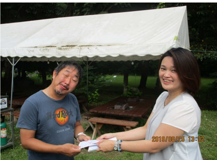
ホールインワン賞飲みすぎ？ 行木会員