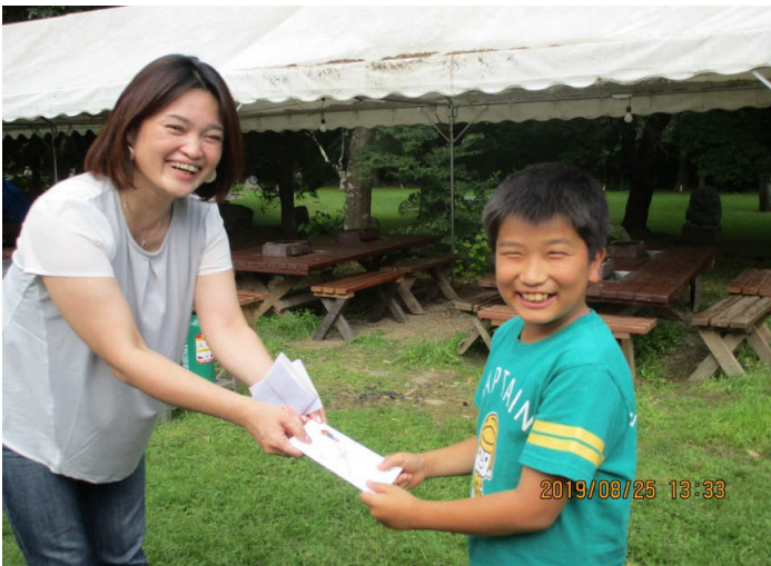
子供賞 笑顔がかわいい