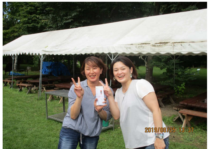
尾崎会員 なんで賞？