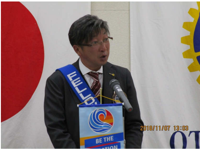
ニコニコ献金（若原委員長）