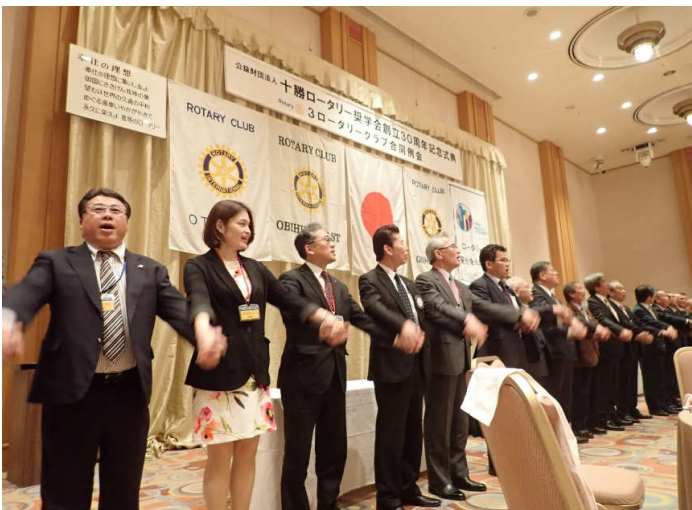
ロータリーソング