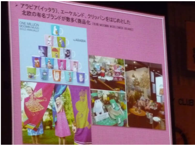
メツアの扱う商品例