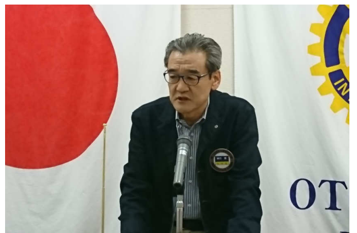
情報委員長 棟方会員