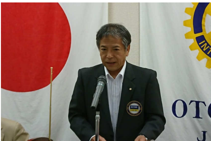
クラブ奉仕・出席委員長 猪子会員