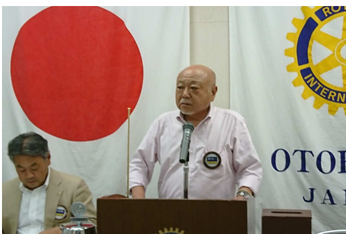
国際奉仕 黒川会員