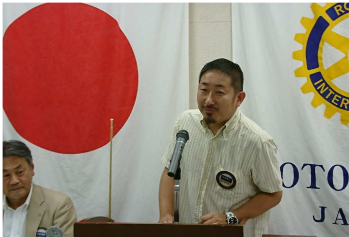
直前会長 行木会員