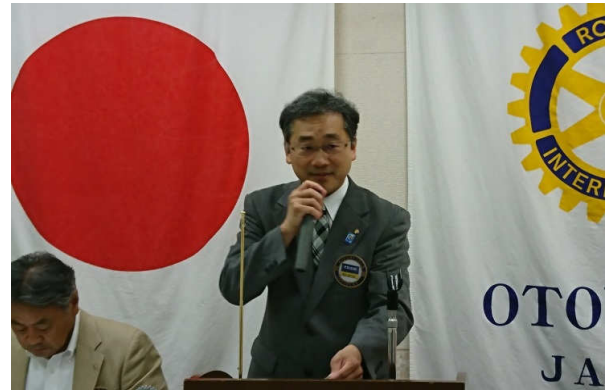
大和幹事より会務報告