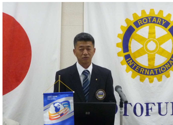
富田幹事より会務報告