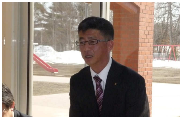
富田幹事より会務報告