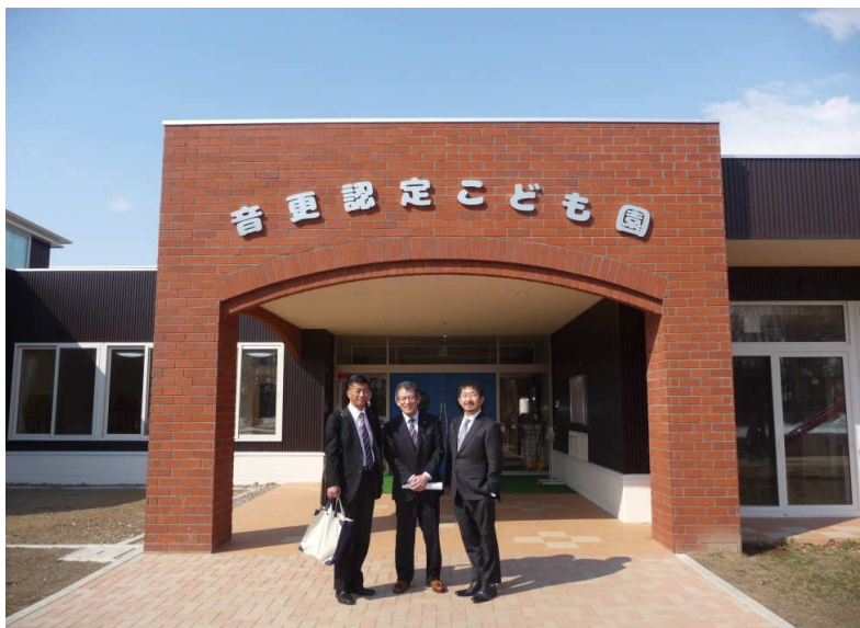
本日の移動例会(職場訪問)『音更認定こども園』前にて