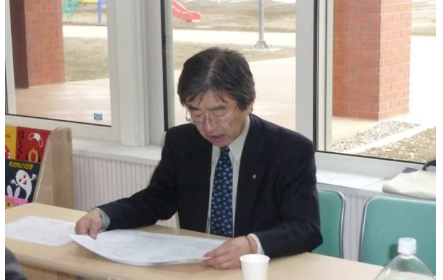
白木会員より『音更認定こども園』の概要についてご説明