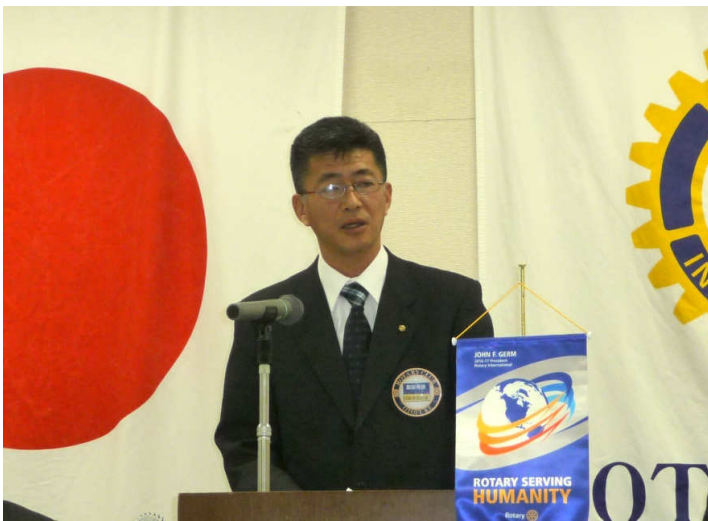
富田幹事より会務報告