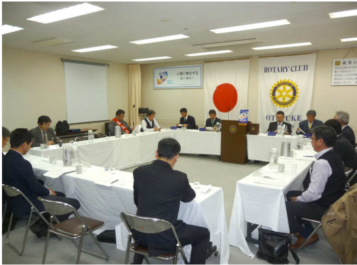
クラブ協議会及び次年度委員会構成について